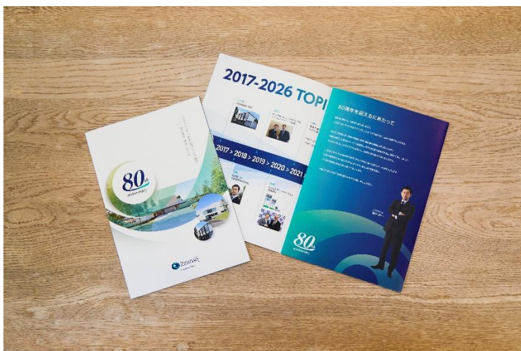
画像：創立80周年を記念して制作した記念誌

記念式典では、80年の歩みを振り返る映像の上映などを通じて、これまで会社を支えてきた先人や関係者への感謝を改めて胸に刻むとともに、節目を迎えた今の想いを共有しました。ゼノアックは、これまで支えていただいたすべての方々への感謝を大切にしながら、日本の獣医療現場に寄り添う姿勢をこれからも貫き、次の時代に向けた挑戦を続けてまいります。創立80周年を新たな出発点として、動物・人・社会に貢献する企業であり続けることを目指していきます。