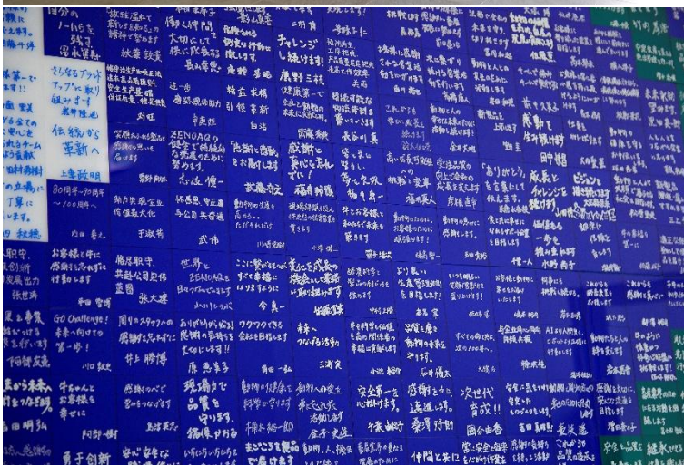
画像：社員一人ひとりの想いや決意が記されたアクリルパネル

80周年記念事業の象徴として、社員一人ひとりが未来に向けた想いや決意を記したアクリルパネルを制作し、それらを組み上げた大型の記念モニュメントを製作しました。社員それぞれの言葉が集まり、一つの形となった本モニュメントは、当社の一体感を表現すると同時に、これからのゼノアックをつくっていく原動力を象徴する存在です。